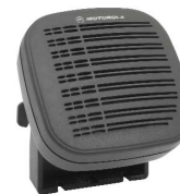
13W Extern Högtalare